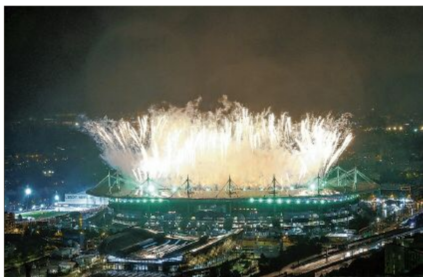
Z jimacej swjatočnosću a spektakularnym wohnjostrojom su wčera w Parisu paralypiske hry 2024 zakónčili.