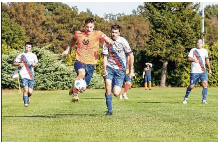
Ralbicanscy Sokoljo dyrbjachu lětsa hižo zahe wokrjesne pokalne koło wopušćić. Wčera podleža mustwo trenarja Christoph Gloxyna jasnje přečiwu hosćom z Němskich Pazlic.