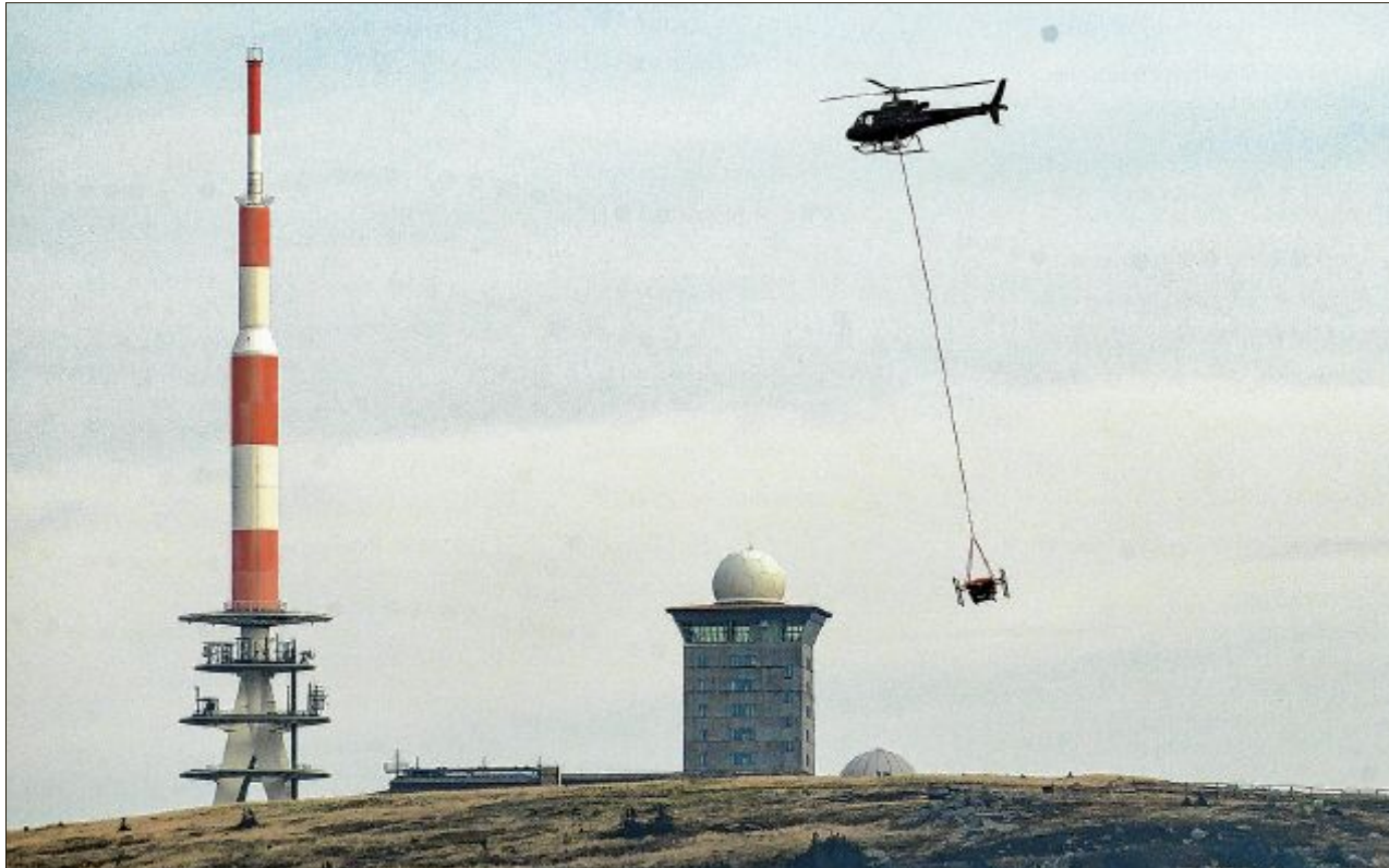
Wohěn njedaloko Brockena w Smolinach dale z helikopterami a lětađłami hašeja. Lěsny wohěn bě minjeny pjatk wudyřił. Dešć je při hašenju pomocliwy. Mla pak pilotow hać, dokelž dosć derje njewidža. Mjez pućowarjami woblubowana kónčina je tuchwilu zawrjena. Přečinu wohenja hišće njeznaja.