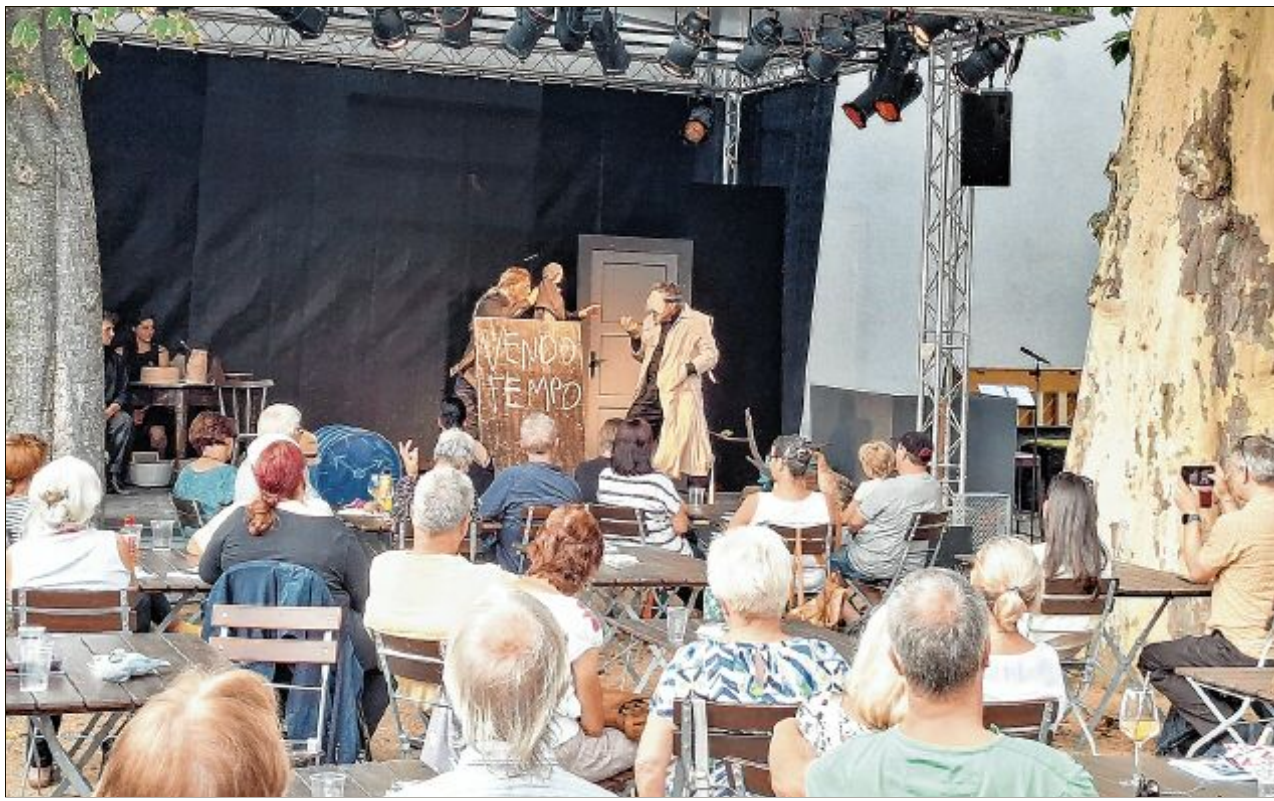
Na zahrodze Němsko-Serbskeho ludoweho džiwaďla zahajichu wčera „mjezynarodny džen“ z koprodukciju Budyskich a galiciskich klankarjow pod hesłom „Spominaj na mnje“. Wurězki dalšich produkcijow třoch džiwaďlow pokazachu potom na hłownym jewišću džiwaďla.

w nocy: 15 do 16 °C rano: 15 °C připódnju: 15 do 18 °C wječor: 14 do 16 °C